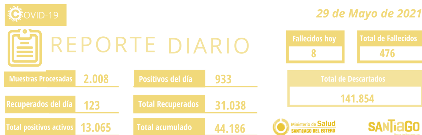
Gráfico 3. Reporte de casos COVID-19 del 29 de Mayo de 2021.

A partir de los datos disponibles de los días 29 de mayo y 6 de junio tratamos de dimensionar la cantidad de casos según la magnitud de las zonas urbanas y rurales consideradas, así como su disminución (D), estabilidad (E) o aumento (A) .